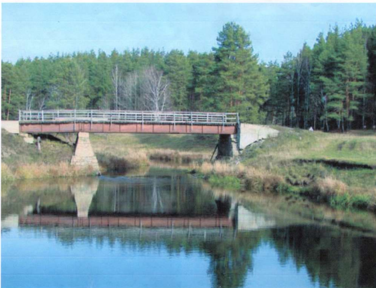
Мост через реку Реж