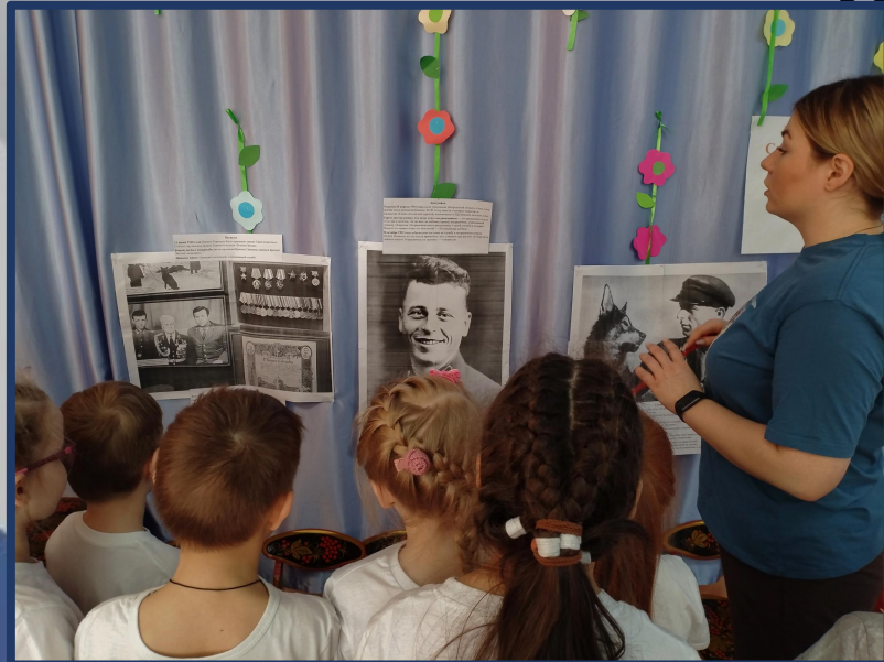
Ребята с большим интересом слушают ...

Мальчики сделали вывод, что хотели бы быть такими же сильными и смелыми