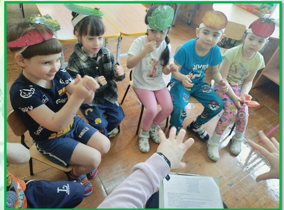
Пальчиковая гимнастика «В нашем огороде»

Дети в дошкольном возрасте очень любознательны. Они проявляют активный интерес ко всему окружающему. Однажды они рассматривали альбом «Овощи», и некоторые овощи им были не знакомы. Тогда они начали интересоваться, что это за овощ. Я спросила у ребят: «Хотите ли узнать, что такое огород и какие овощи на нём растут? Всем детям стало интересно, и мы решили сделать это в проектной деятельности. Так появился проект «Вот веселый огород, что здесь только не растёт!».