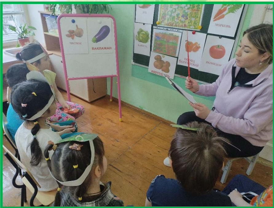
Познавательное занятие «Что такое огород и что на нём растёт?»