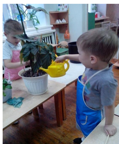
Работа в цветнике