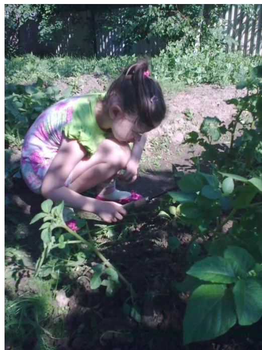
Рыхление почвы с использованием инструмента.