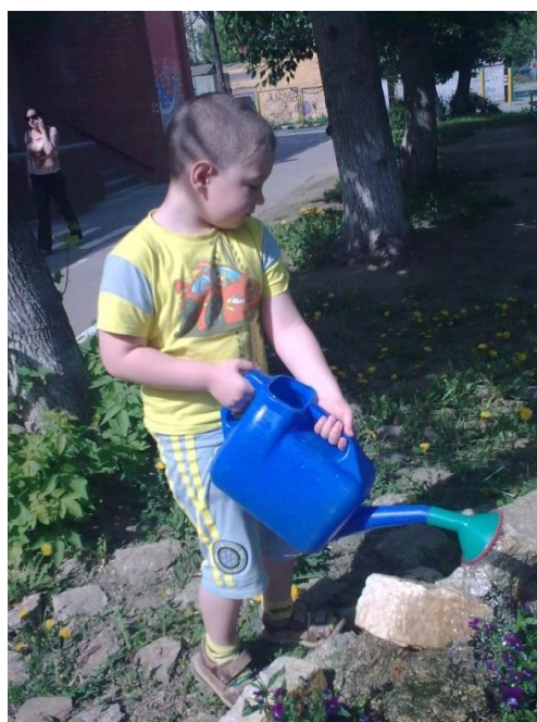
Полив садовых растений