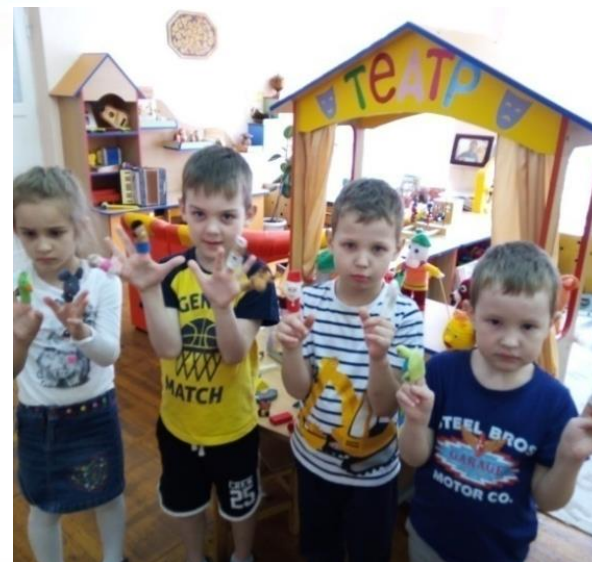
Центр театрализованных игр