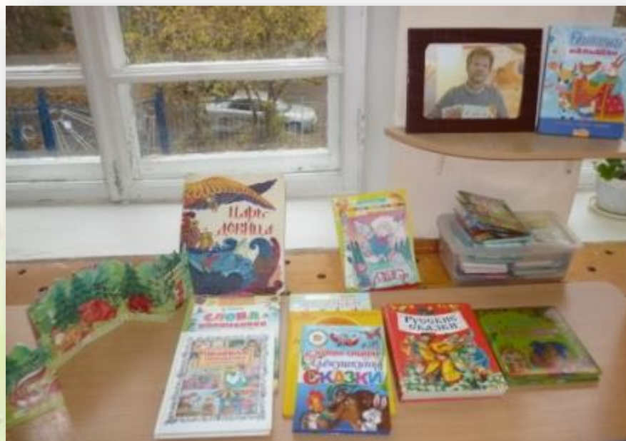
Центр художественной литературы