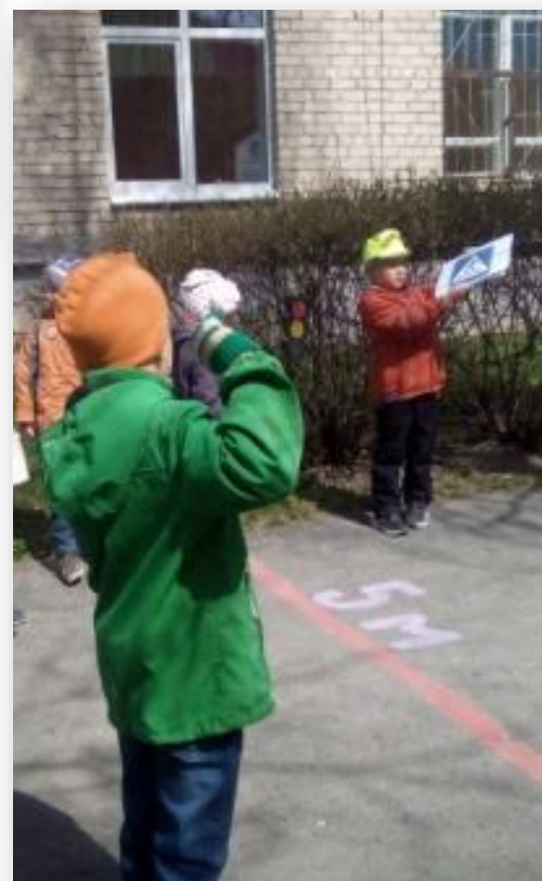
Закрепление знаний ПДД