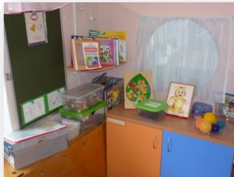
Речевой центр в группе