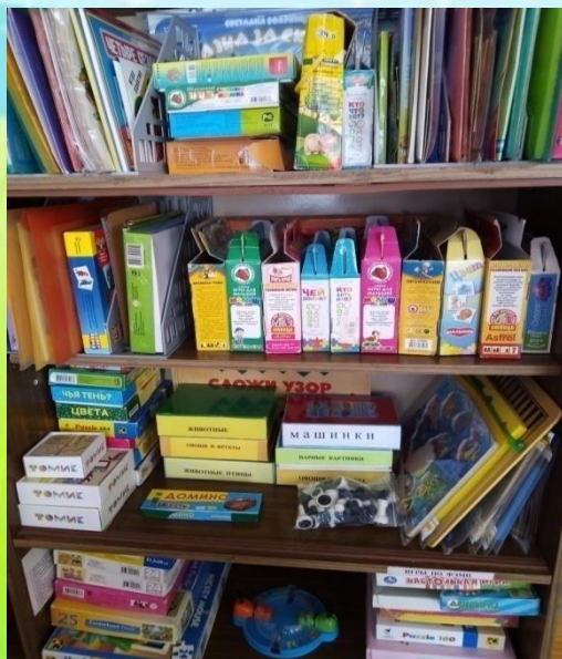
Центр дидактических и настольно- печатных игр