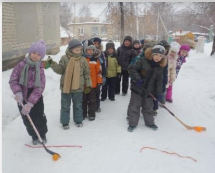
Игры и упражнения на улице в зимний и летний период