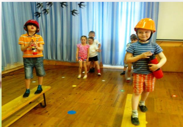
Формирование основ противопожарной безопасности