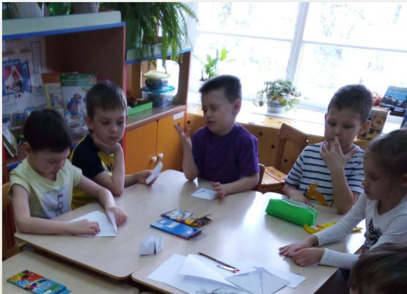
Комплекс занятий по оригами