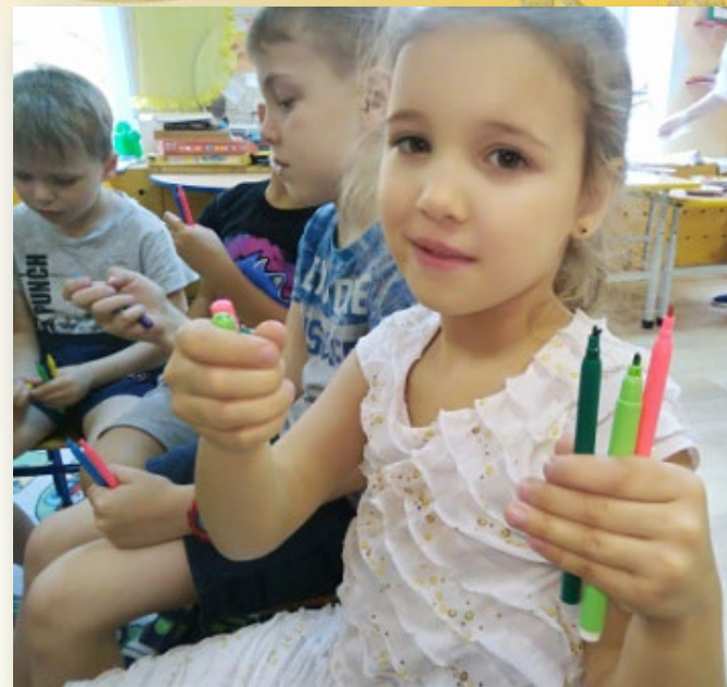
«Домик для колпачка» Развитие мелкой моторики, соотношение цветов