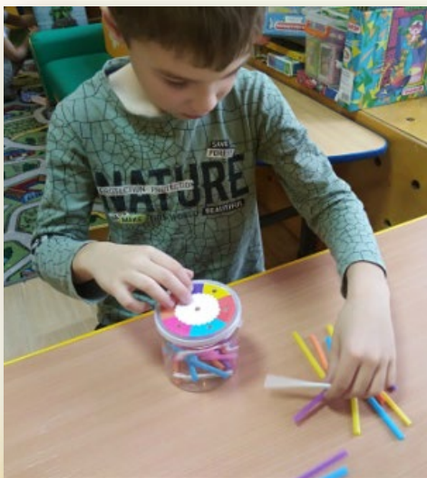
Игрушка –сортер: изучение цветов и оттенков, развитие координации движений