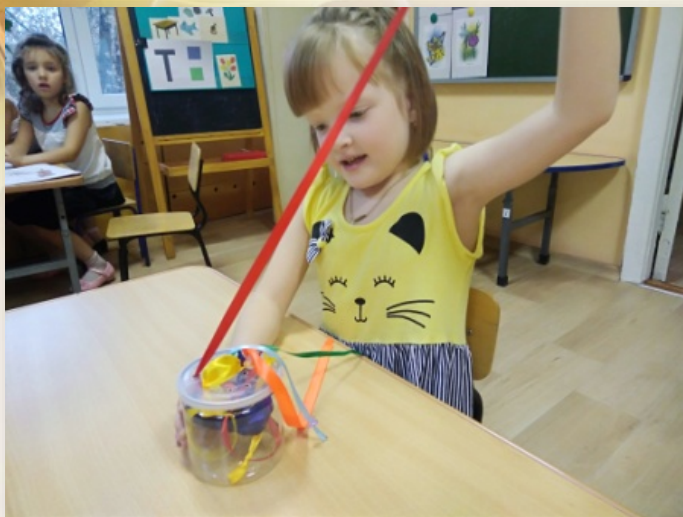
«Радуга на ладошке» Изучение цвета, длины и ширины