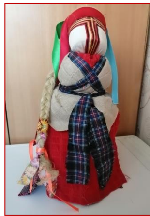
Дружка на свадьбе