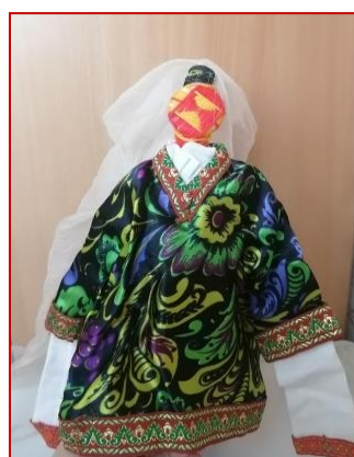
Таджикская пара – лухтак